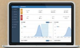
食堂后台、进销存系统